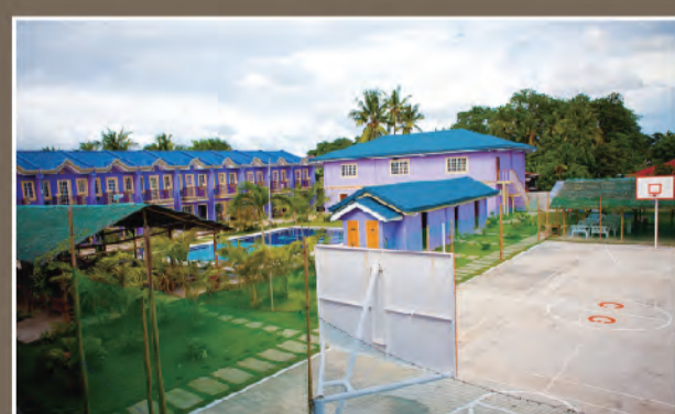
バスケット場/卓球/運動器具